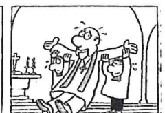
B Um den Pfarrer bei der Messe zu unterstützen