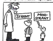
C Weil Stranten so selten sind