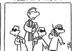
D Als Bodyguards des Priesters

Falls du keine Möglichkeit hast, nach Rieden zu kommen, dann melde dich doch bitte bei: